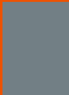
PÁGINA COMPLETA 210 x 297